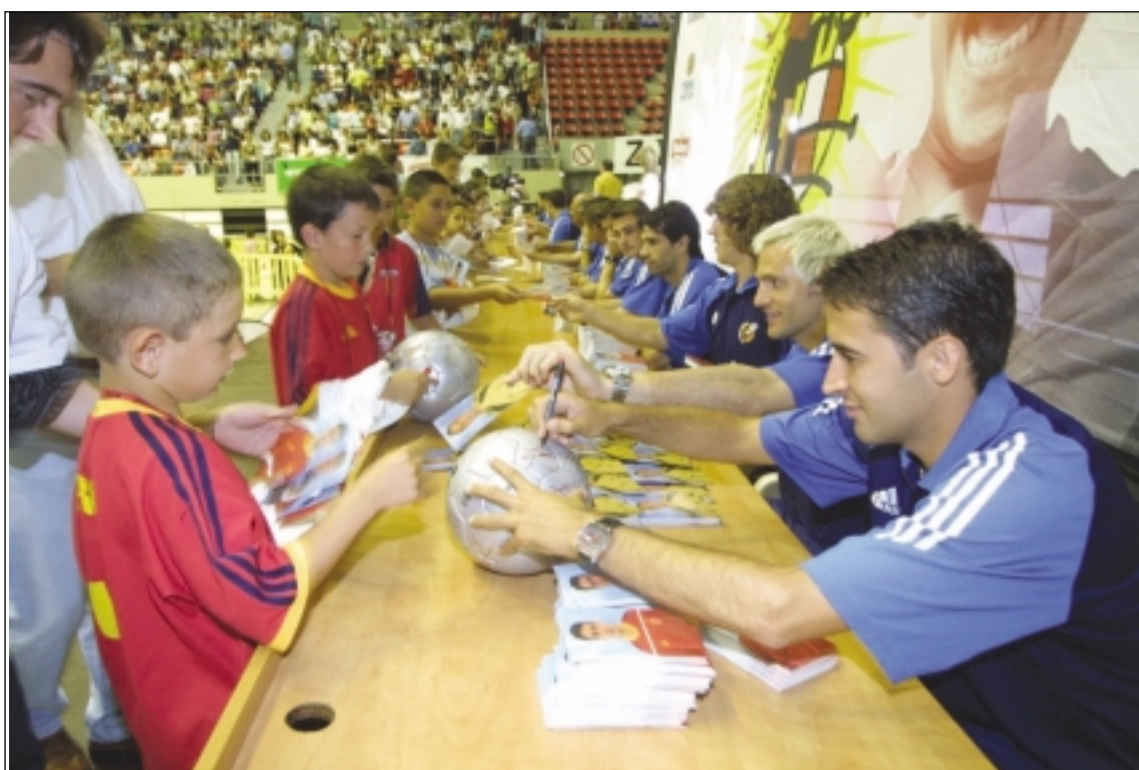
Cuatro mil niños compartieron en el Príncipe Felipe un rato con sus ídolos futbolísticos. JAIME GALINDO