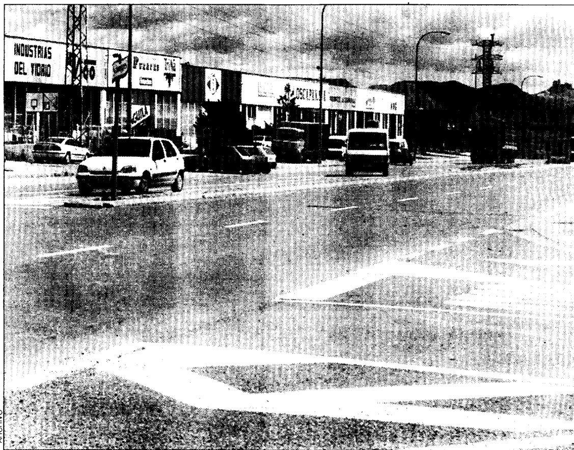
Imagen del Polígono Monzú.