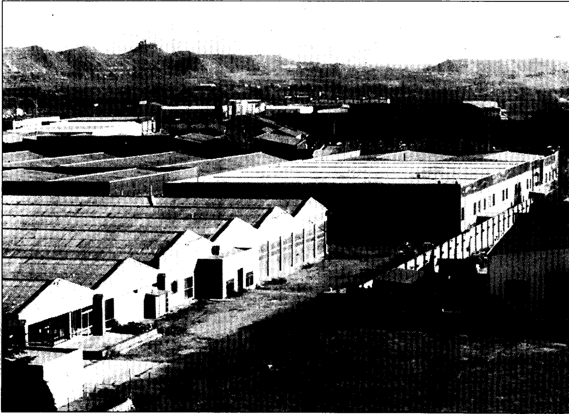
Monzú une los polígonos industriales de La Magantina y SEPEs.

ur. Esta cantidad llega a la corporación municipal oscense a través del convenio de los trescientos millones de pesetas que el Gobierno de Aragón y el Conce-