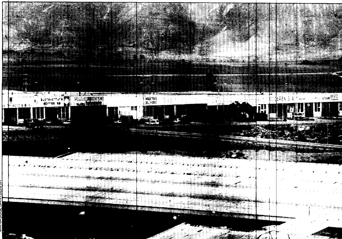
En la zona norte se está construyendo la nueva variante de Huesca.

La iniciativa privada comenzó a desarrollar el uso industrial de este suelo a comienzos de la década de los años setenta. Casi treinta años de historia que han llevado a la ocupación de un total de ciento nueve parcelas. La más grande tiene treinta mil metros cuadrados y, la más pequeña, cuatrocientos. El precio medio de venta, siempre según dicha fuente oficial de la Diputación General de Aragón, se sitúa en las dos mil ochocientas pesetas el metro cuadrado.