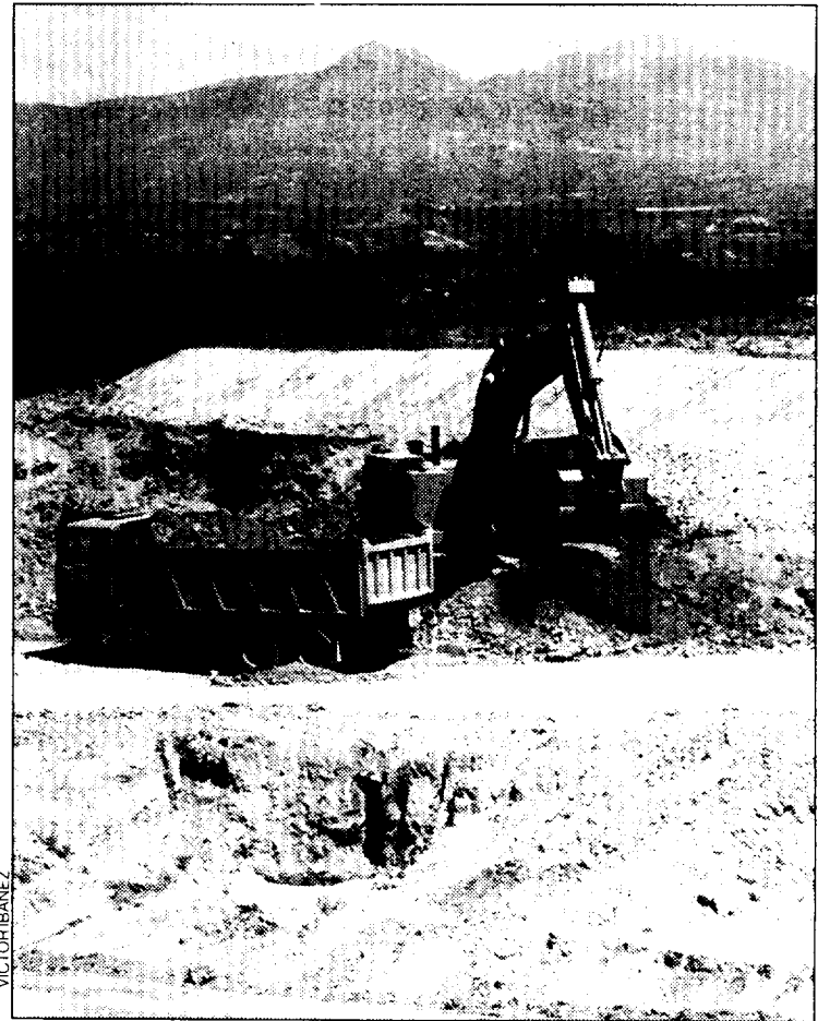
La maquinaria mueve el terreno en la zona de la variante.