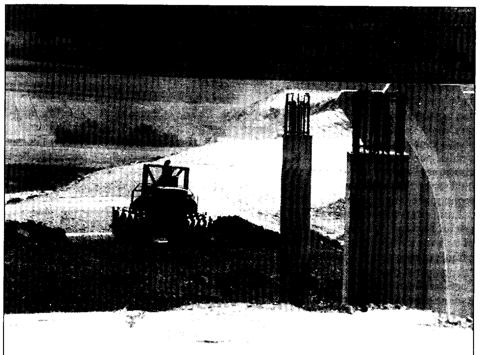
Las vigas para uno de los puentes.