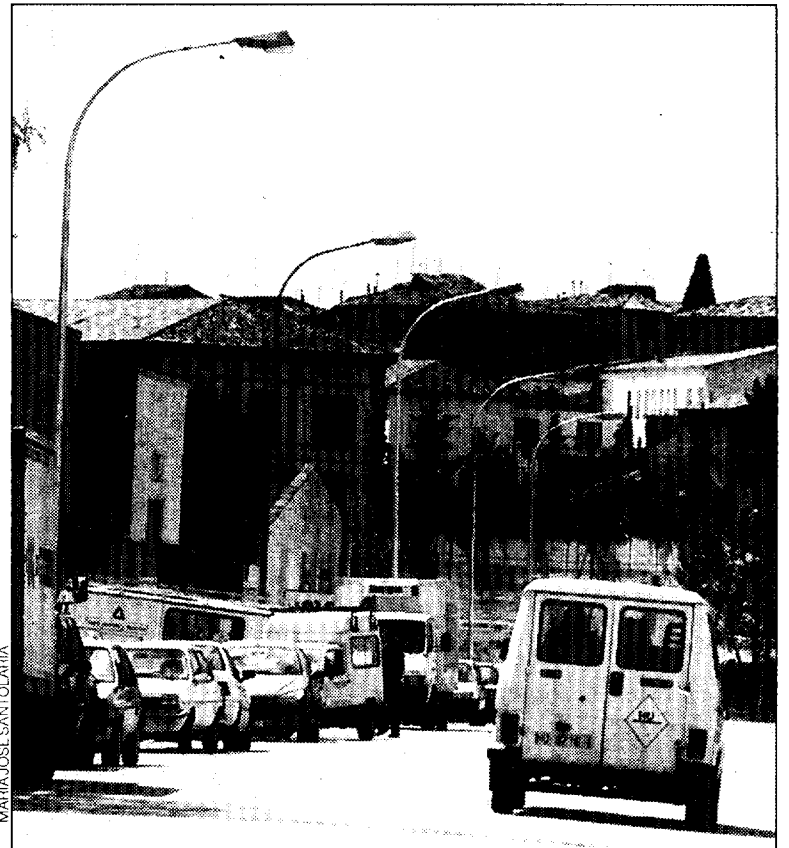
Numerosos vehículos aparcen diariamente en esta zona.

de La Magantina, ya que se cuenta con vigilancia por parte de la policía de barrio.