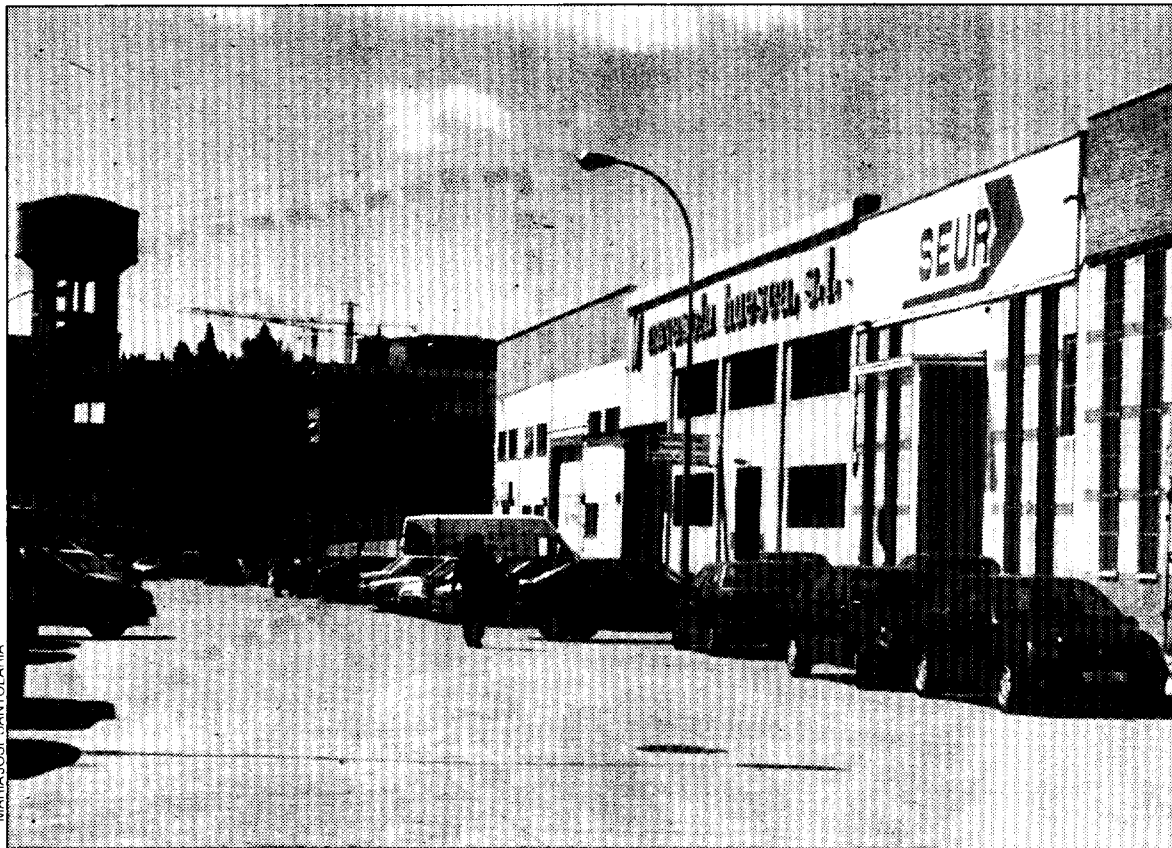
Imagen de una de las calles del polígono.