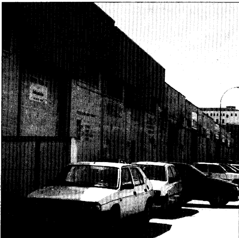
Aspecto de unas naves del polígono.

□ El polígono cuenta con una total de 8,5 hectáreas de superficie. La Magantina fue urbanizada a principios de los años 80, por iniciativa privada, pero, antes de que se iniciara la actividad en la zona, se pasó a un sistema de cooperación, en el que intervino el Ayuntamiento de la capital altoaragonesa