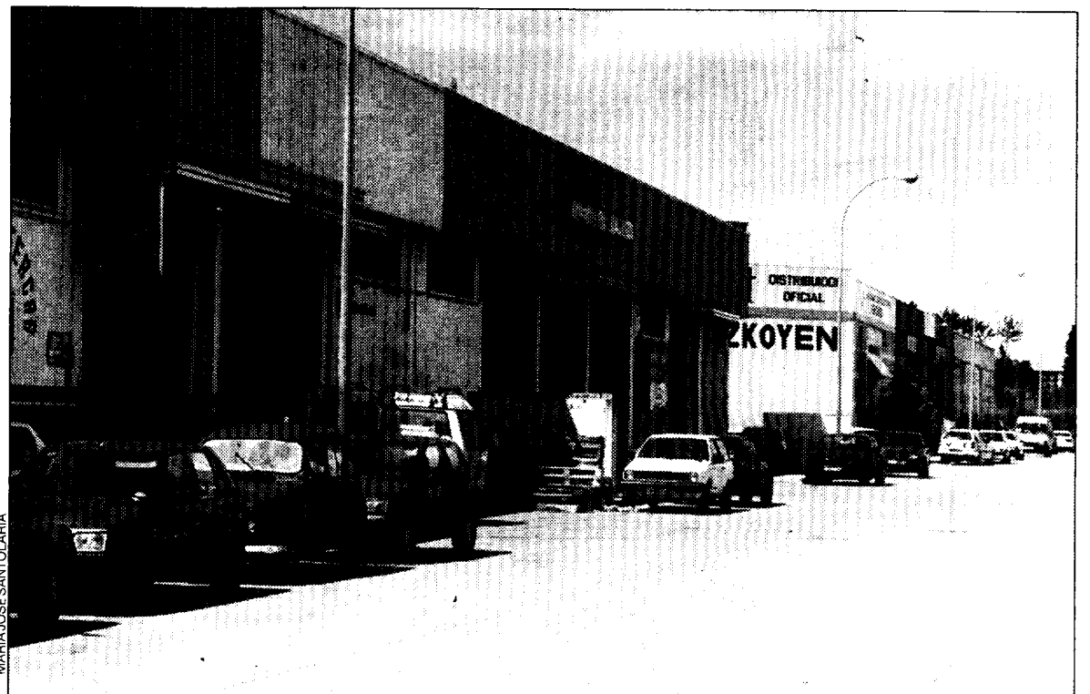
La zona es apropiada para todo tipo de actividad.