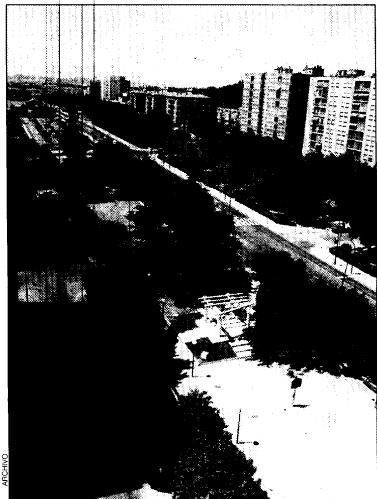
Vista del barrio de La Encarnación.

La mejora de la ermiña, con obras de rehabilitación y mantenimiento, es otro de los proyectos barajados por el Ayuntamiento oscense.