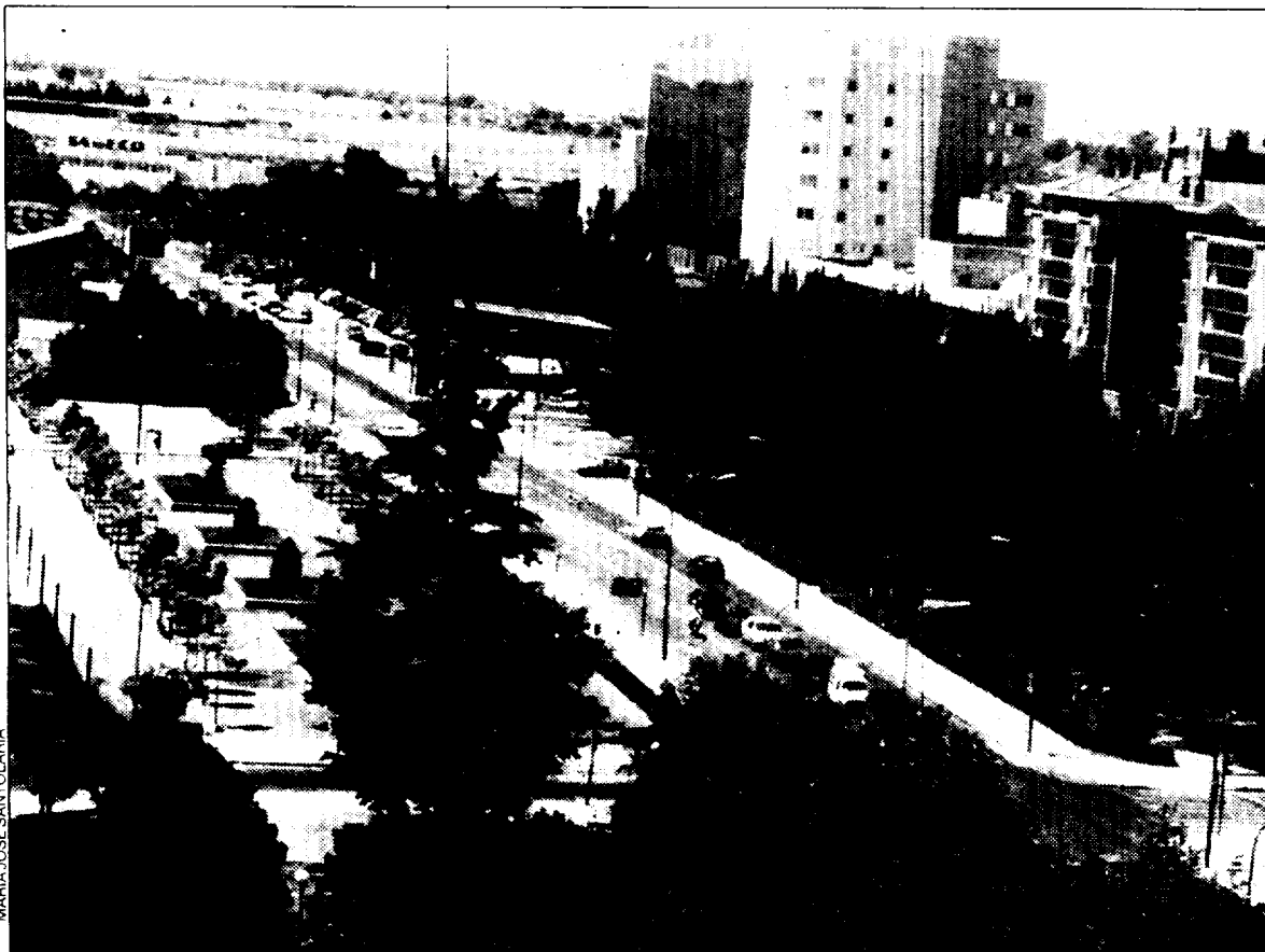
Avenida de Martínez de Velasco.

gas y suministro eléctrico, con una potencia eléctrica disponible de 4.410 Kva.