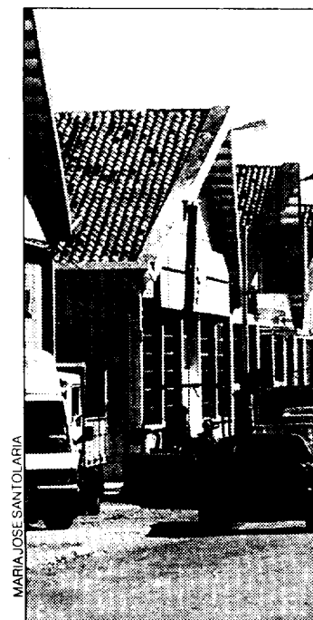
En la zona hay 128 empresas.

El crecimiento económico demográfico de la ciudad aquellos años, echó atrás el p