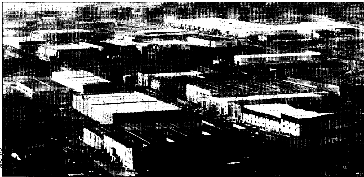
Imagen aérea del Polígono SEPEP.

Respecto a nuevas zonas, el avance indica: "Las medidas habrán de centrarse en la selección y el control de los asentamientos, la ordenación adecuada de estas áreas, la dotación de las infraestructuras requeridas y el impulso en su gestión y urbanización, posibilitando su implantación si se produce la demanda de inversión necesaria para ello. Lógicamente, deberán favorecerse las relaciones con sectores punta y de alta tecnología y, en general, las que no suponen riesgos medioambientales."