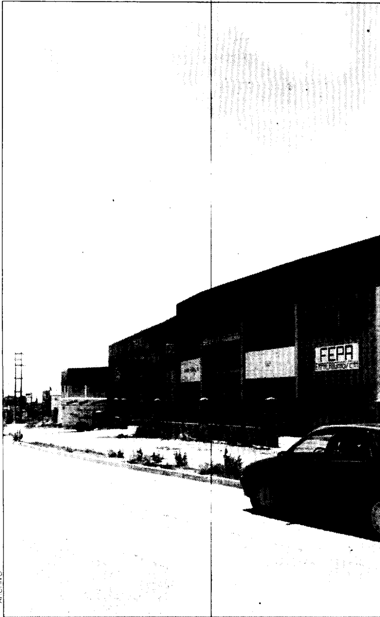
La reorganización del suelo industrial es uno de los asuntos pendientes en Huesca.