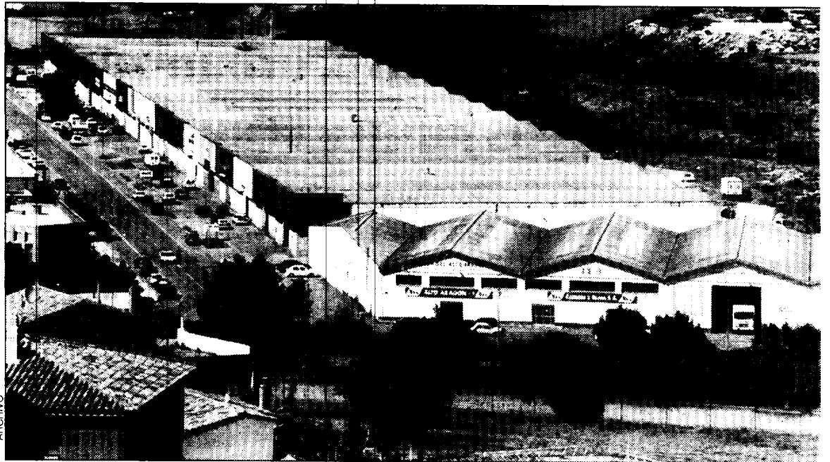
Vista del Polígono La Magantina.

El avance data de 1994 y el trabajo, parado entonces, no se ha retomado