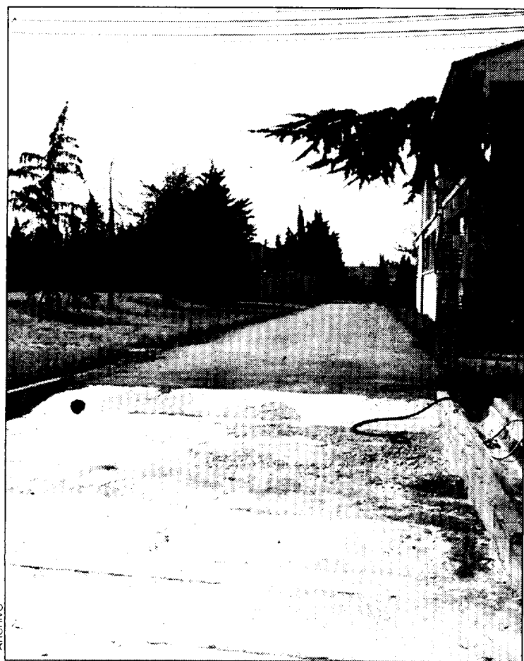
Imagen de la Granja San Lorenzo.

Respecto al Plan General de Ordenación Urbana (PGOU) de la ciudad, el alcalde recuerda que ya está en vigor la Ley aragonesa del Suelo, por lo que está ya libre el camino para continuar con el trabajo iniciado la pasada legislatura. La conclusión, ineludiblemente, debe lograrse en los próximos meses.