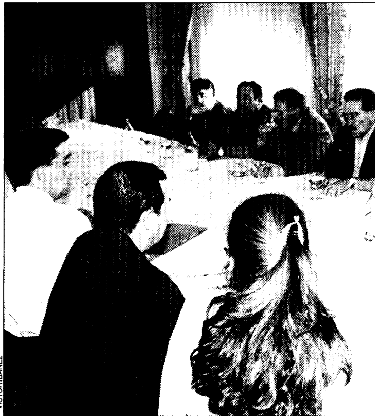
Imagen de la reunión mantenida por la organización del Certamen con representantes políticos.

El incremento de precios en Teruel fue también del 0,3 por ciento. Su tasa interanual es del 2,6 por ciento y la tasa acumulada del 0,8 por ciento.