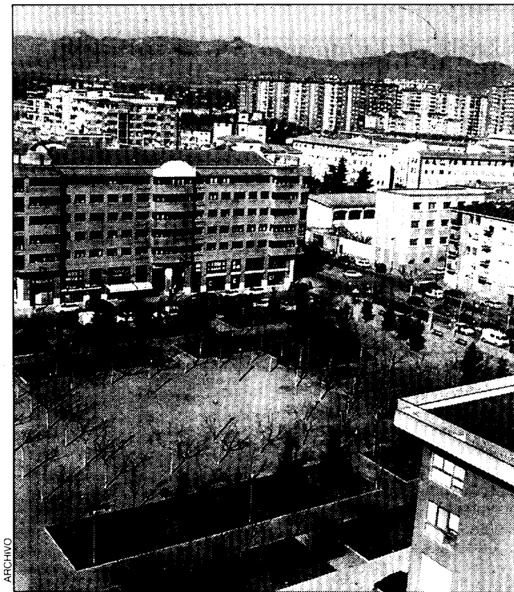
Imagen de la capital altoaragonesa.

El aumento de precios fue inferior en los grupos de otros y cultura con el 0,2 por ciento, vestido y medicina con el 0,1 por ciento y