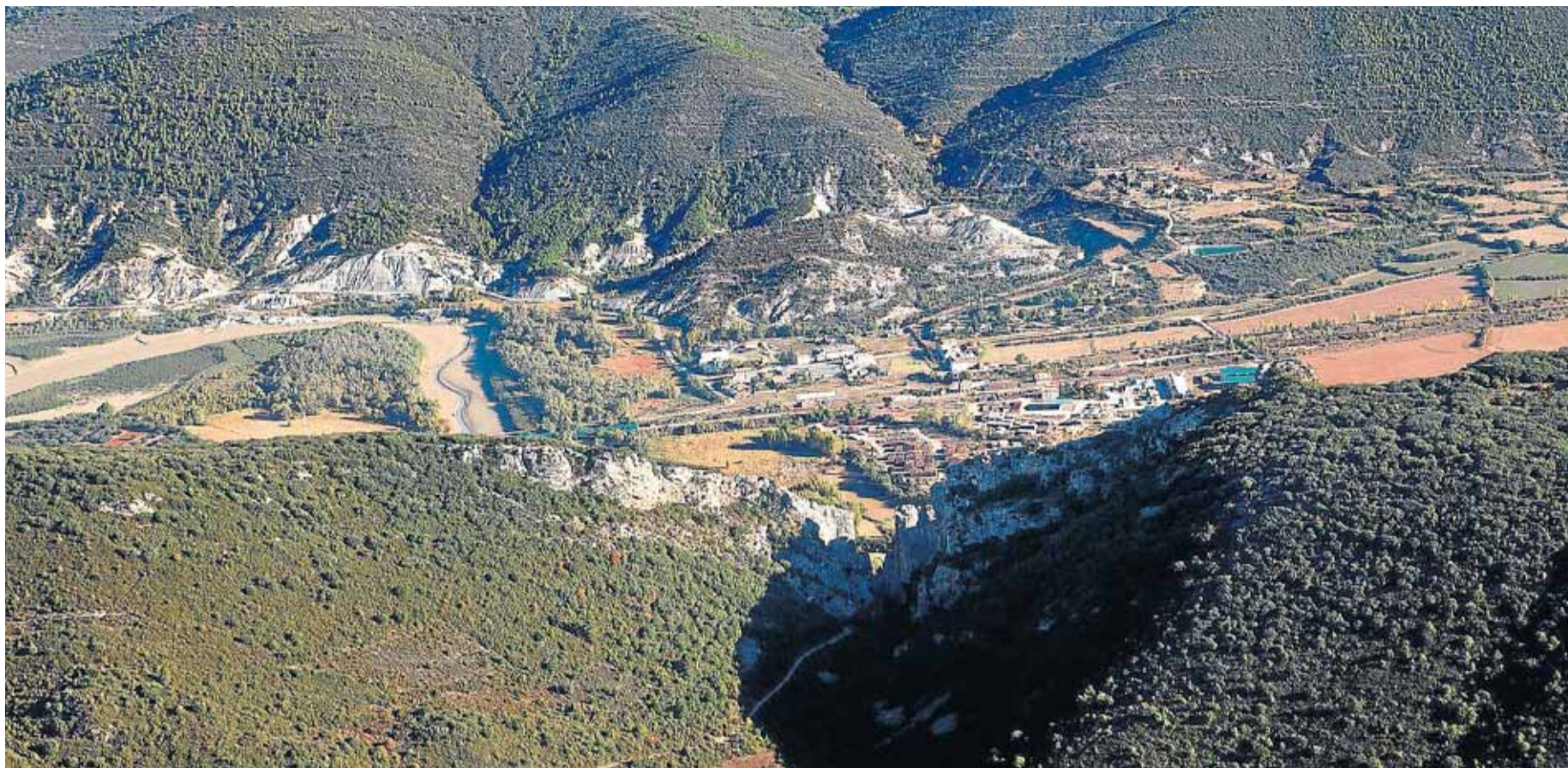
Vista aérea de la Foz de Escalete.

Escapada por el Reino de los Mallos. Una bonita excursión senderista por paisaje de sierra.