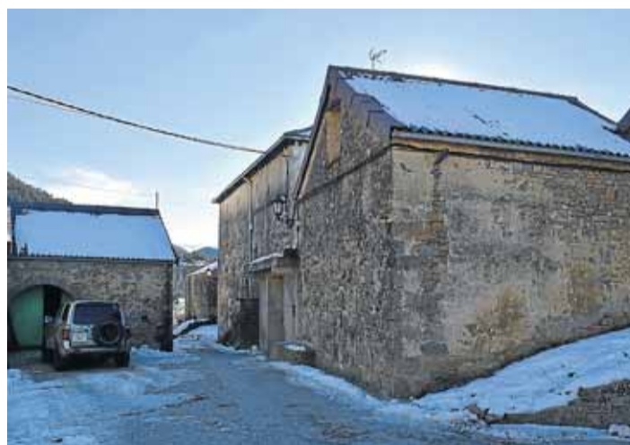
Casa Sanromán y calle que va a la iglesia

Cuaderno de viaje. El pueblo al que hacemos referencia hoy atesora una dilatada historia pese a su pequeño tamaño.