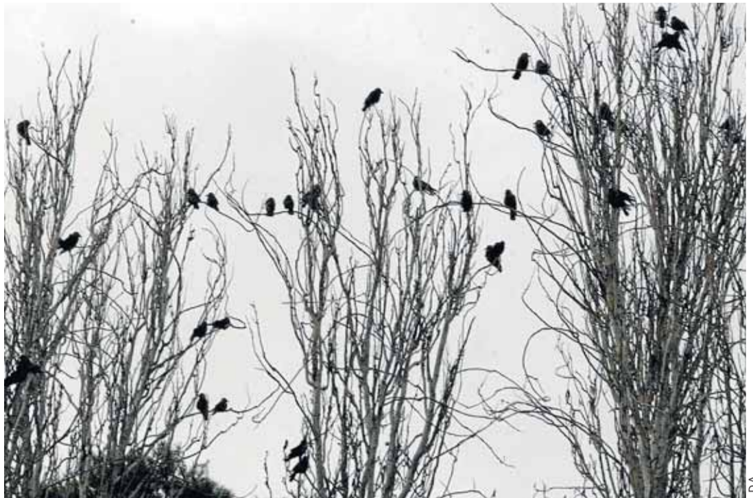
Estorninos en árboles del Parque Miguel Servet.

Recuerda la concejala que se están utilizando diferentes técnicas para ahuyentar a estas aves, como el puntero láser y los gritos de alarma que utilizan los estorninos para avisar de un peligro, "que es lo que más les molesta", y añade que "los halcones ya no los utilizamos e intentamos usar lo menos posible, por las quejas de los vecinos, los disparos, los cohetes, que es lo que más les