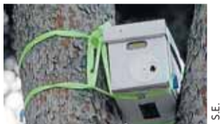
Una de las 9 cajas cazaenjambres distribuidas en la ciudad.

El inspector jefe del parque enfatizó durante la presentación de la memoria anual el