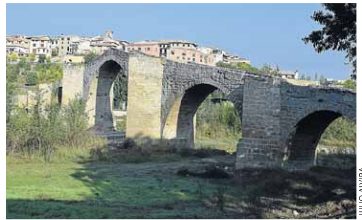
Capella y el puente, origen del paseo.