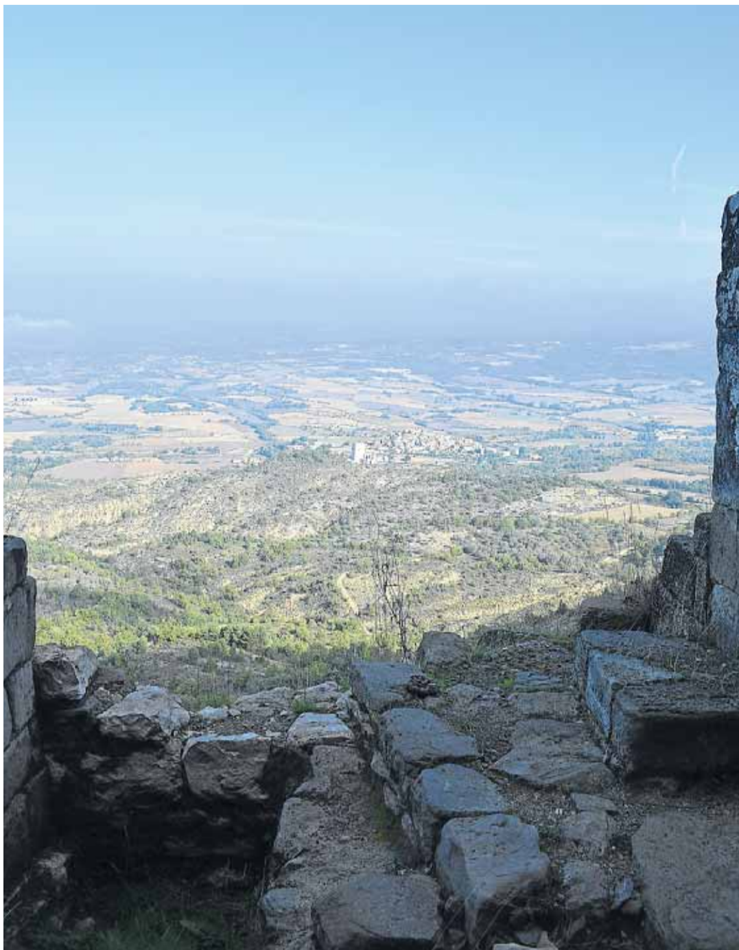
Capella desde San Martín.