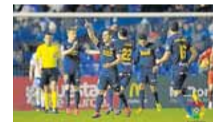
El UCAM celebra el gol del triunfo ante el Zaragoza anoche.

En el choque, que comenzó con el equipo murciano siendo colista, los dos conjuntos lucharon por hacerse con el dominio del partido