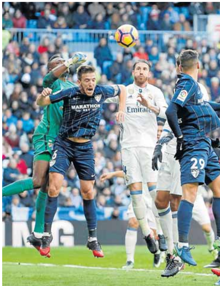
Sergio Ramos fue el gran protagonista del encuentro al anotar los dos goles de la victoria del Real Madrid.

El defensa con alma de goleador sigue siendo el salvador. Sergio Ramos volvió a aparecer con goles claves para empujar al