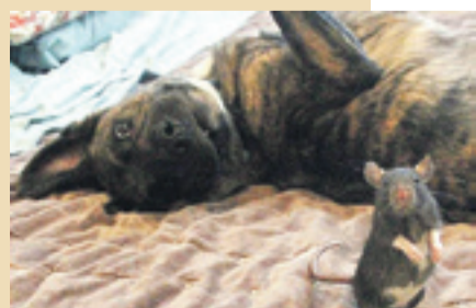
Osiris y Riff posan para la cámara. S.E.