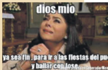
Rezando para que lleguen las fiestas. S.E.