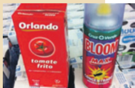
Tomate frito y antimosquitos. S.E.

Agosto es el mes de las fiestas patronales de los pueblos. No sólo en la provincia altoaragonesa también en el resto del país las plazas de las pequeñas localidades se llenan de música, ambiente y jolgorio. Muchos, como la mujer que vemos en la imagen, desean tanto que lleguen por fin estos festejos que acaban por encomendarse a Dios, seguro a más de uno le habrá pasado lo mismo.