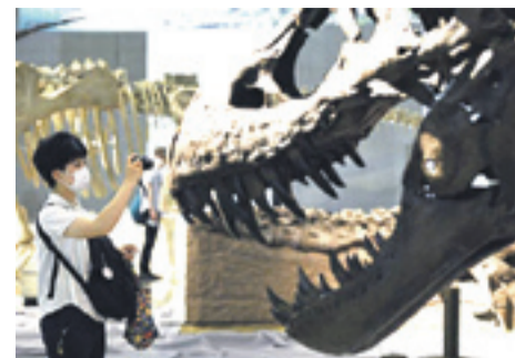
Un japonés contempla el dinosaurio. S.E.

Los restos del dinosaurio más grande de Europa, un raro ejemplar descubierto en Teruel (España), se exhiben por primera vez en Japón en una gran exposición dedicada a estas criaturas en la ciudad de Chiba, al este de Tokio. La muestra, cuya atracción principal es una reconstrucción del "Turiasaurus riodevensis", incluye otras especies de estos reptiles fósiles como el popular "Tyrannosaurus rex", el "Stegosaurus" y el "Diplodocus carnegii". Los fósiles del "Turiasaurus" fueron hallados en 2003 en la provincia de Teruel, incrustados en un estrato de roca formado hace unos 140 o 150 millones de años (finales del período Jurásico o principios del Cretácico).