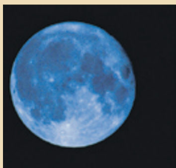
'Luna azul', un fenómeno inusual. s.e.