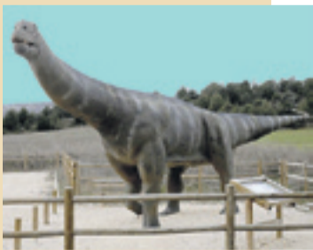
Ruta de los dinosaurios en Burgos. s.e.

Un hospital de Estados Unidos logró que Zion Harvey, de ocho años, se haya convertido en el primer niño del mundo en recibir un trasplante en las dos manos, lo que marca un hito en medicina infantil, al lograr adaptar a los más pequeños una técnica de trasplante reservada, hasta ahora, a los adultos. La operación para implantar al pequeño unas manos y unos antebrazos se realizó a principios de julio y ahora el niño, de nacionalidad estadounidense, se prepara para cumplir su sueño y lanzar un balón. E.P.