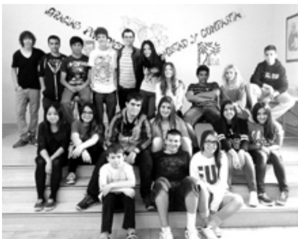
El grupo de teatro sigue vivo. s.e.

Un año más el grupo de teatro de Secundaria del colegio San José de Calasanz de Barbastro ofreció la adaptación de una obra de Alfredo Gómez Cerdá, Premio Nacional de Literatura Infantil y Juvenil 2009. A través