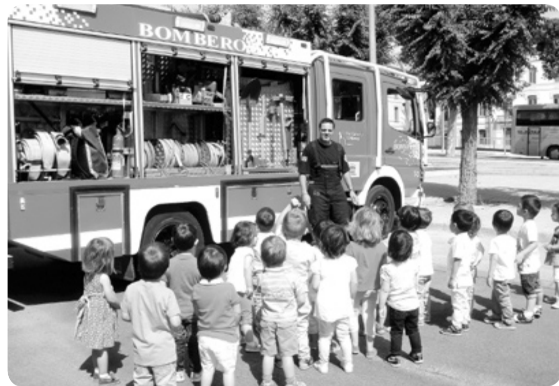
Los niños conocieron todos los camiones que tienen en el Parque de Bomberos. s.e.