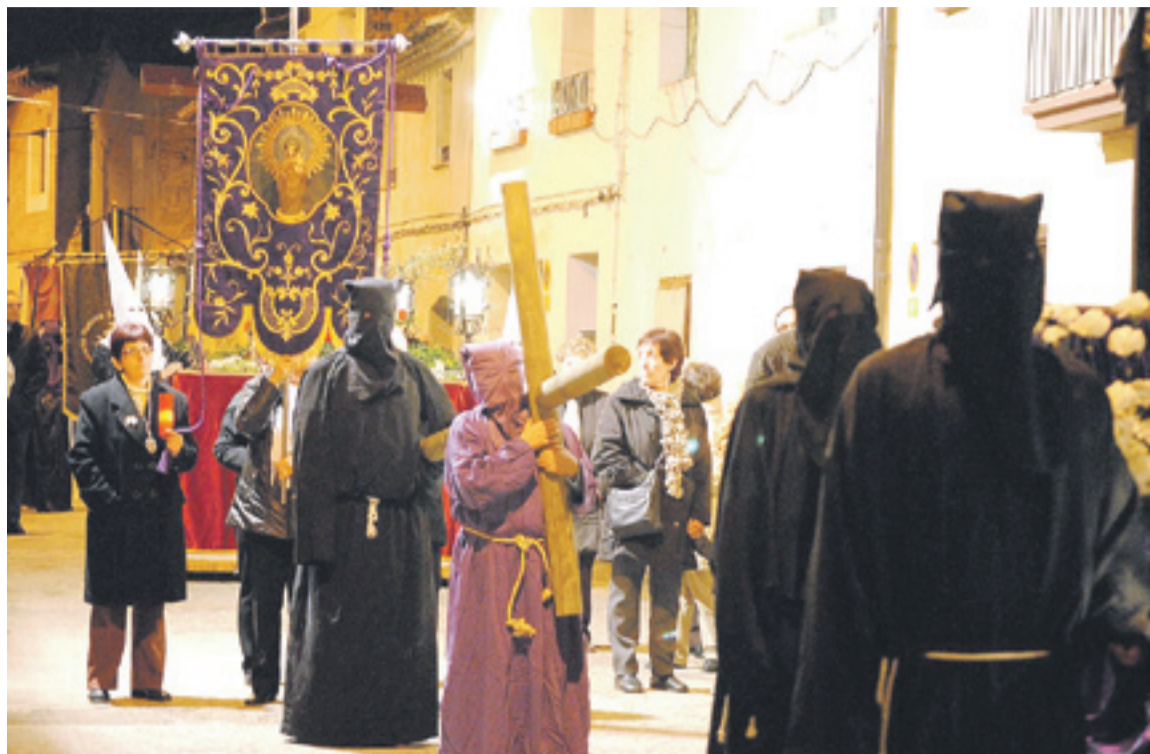
Belver de Cinca volverá a sacar los alabarderos acompañando a su procesión.

En Candanos, tiene lugar cada lunes de Pascua la tradicional romería hasta la ermita de San Isidro, en la que se reparte entre toda la población la popular "rosqueta", también conocido como pan de caridad o de San Isidro. Ese día, también es tradición en el resto de municipios salir al monte a comer la "Mona de Pascua".