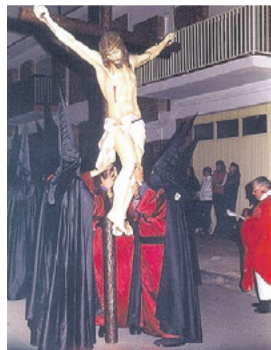
Una procesión de Semana Santa en Mequinenza. S.E.