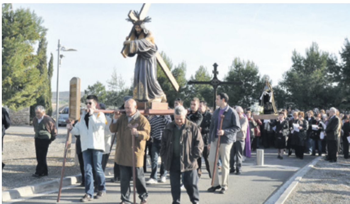
Fraga volverá a celebrar el Vía Crucis en Viernes Santo. S.E.