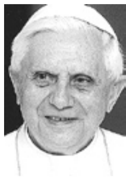
Joseph Ratzinger, Benedicto XVI