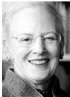
Margarita, reina de Dinamarca