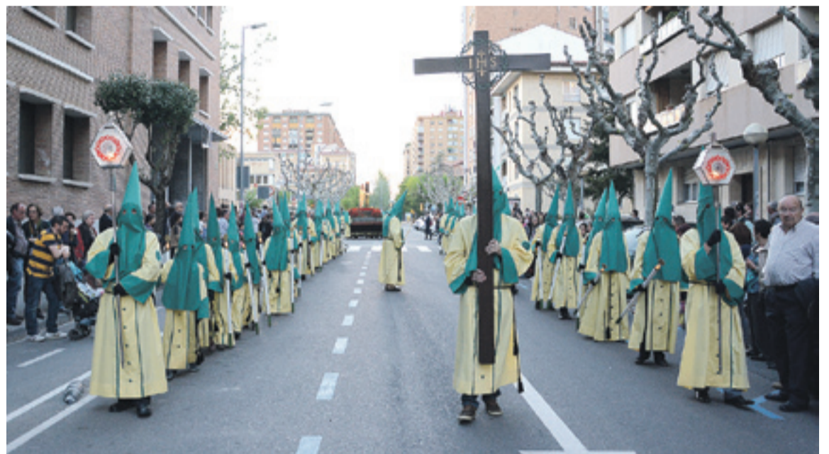
Procesión de Jesús Atado a la Columna en Huesca. JALLE AÑANOS

Los pasos de Jesús atado a la Columna y el de la Coronación de Espinas despiertan emoción e interés en Huesca