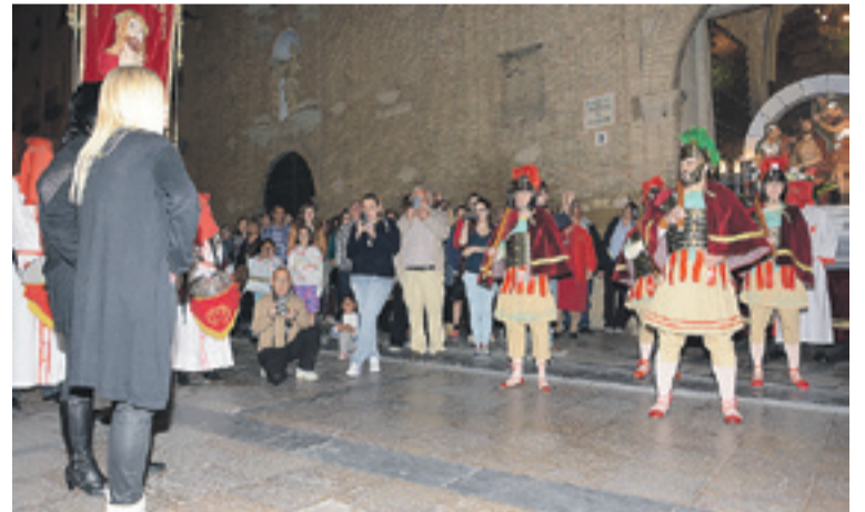
Procesión de la Coronación de Espinas, ayer en Huesca. JALLE AÑANOS

Hoy Huesca ofrece dos nuevas citas procesionales. A las 20 horas saldrá La Enclavación, portada por la Cofradía de Santiago, y a las 23 horas, la procesión de Nuestro Padre Jesús Nazareno, organizada por la Real Cofradía de su mismo nombre.