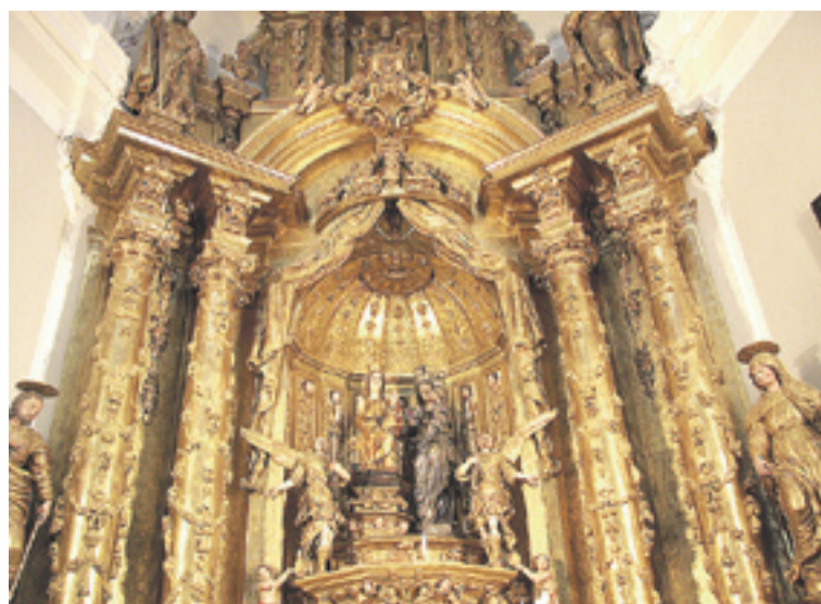
La talla de la Virgen de Salas en el altar de la ermita. M. GARCÍA