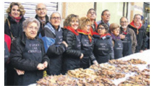
Imagen de la pasada edición de la fiesta.

La Muestra de Cine realizado por Mujeres recalca en Boltaña este fin de semana con diferentes actos. Esta tarde, a partir de las 17 horas, se proyectará en el Palacio de Congresos una selección de varios cortos. A continuación, tendrá lugar el homenaje a Alice Guy, pionera del cine mudo. Por la noche habrá concierto de Conexión Nirvana y mañana más cine realizado por mujeres.