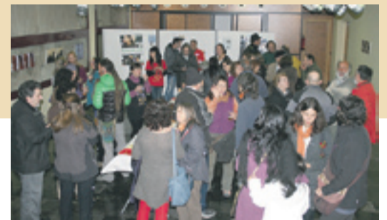
Numeroso público en la exposición de la Muestra. E.L.