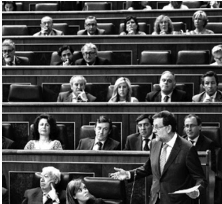
Rajoy, ayer en el Congreso de los Diputados.

Rubalcaba insistió en que Cospedal “dijo lo que dijo: que fue usted, en el despacho de presidente del PP, el que pactó con Bárcenas un acuerdo de protección y de ayuda”. Tras acusar al PP de obstruir la acción de la Justicia y destruir pruebas al romper “a martillazos” los discos duros