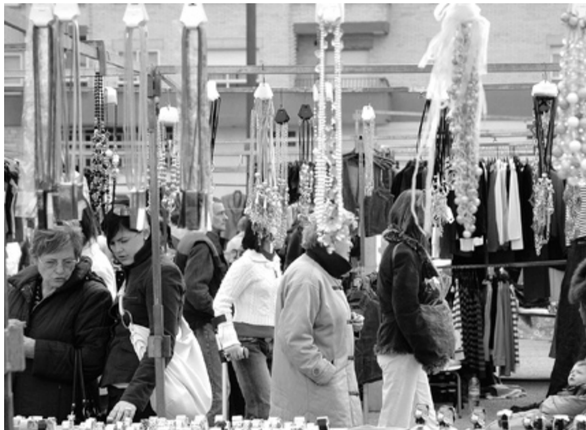
La población aragonesa empezará a bajar en 2018 si se mantiene la tendencia. D.A.

España comenzaría a experimentar tasas de crecimiento demográfico ligeramente negativas en el presente año. Además, y en caso de mantenerse las tendencias demográficas actuales, perdería más de medio millón de habitantes en los próximos 10 años, después de un periodo de intenso crecimiento poblacional. De esta forma, la población se reduciría hasta los 45,6 millones en 2021. La población española de-