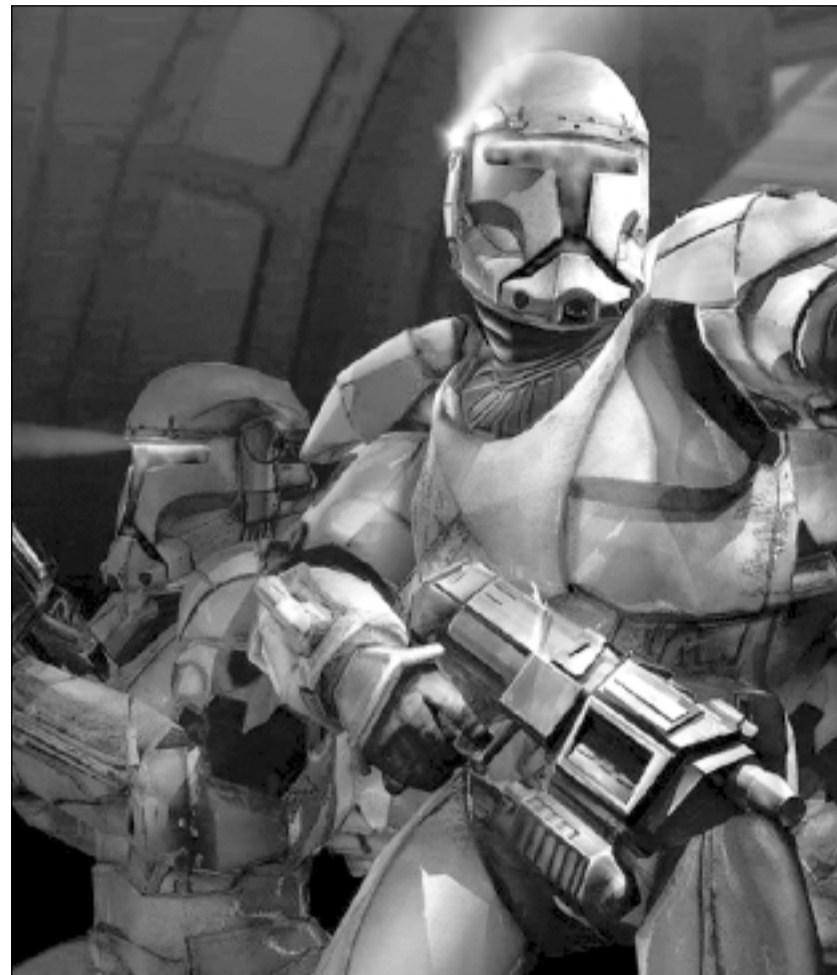
Imagen de la película "The Clone Wars" que preestrenará Neox el próximo 30 de noviembre

Además, Neox es el canal más visto en el 84,4 por ciento de los meses de estos tres años. Tam-