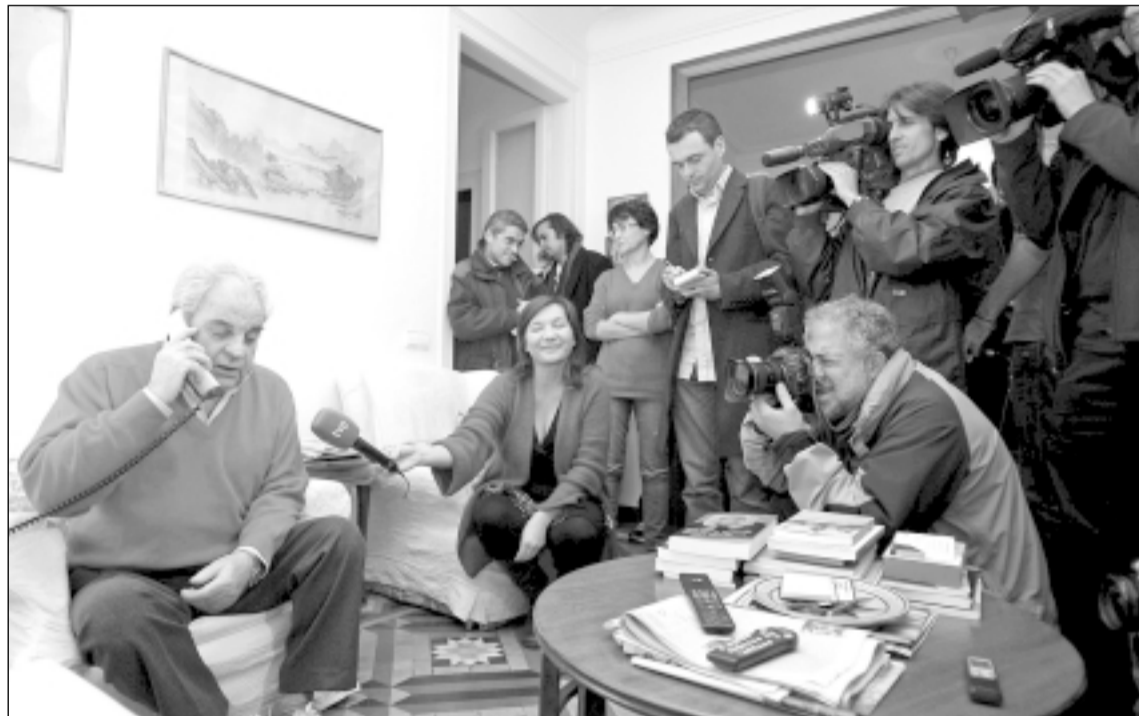
Juan Marsé conoca en su casa, y ante una gran expectación, que había sido galardonado con el Premio Cervantes.

El Cervantes lo ha ganado también Marsé, según Blecuá, "por su sensibilidad para reflejar el español o castellano hablado en Cataluña, representado muy bien por los personajes de sus novelas". Y el poeta argentino Juan Gelman, ganador de la pasada edición del premio y miembro del jurado, hizo hincapié en la dimensión internacional de la obra de Marsé, al subrayar que "ha contribuido a la renovación de la novela en lengua castellana, y no solo de la