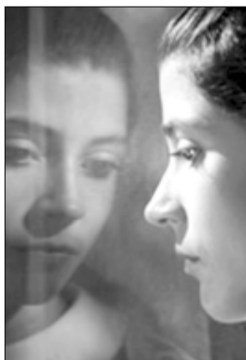
Fotograma de "Forasteros".