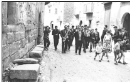
Tocando por el pueblo. LA VIDA EN UN MINUTO

Con 14 años, Fumaz empezó a trabajar de albañil con su padre y sus dos hermanos, y a los 16 se cayó de un andamio. En 2004 contaba a DIARIO DEL ALTOARAGÓN: "Perdí el juego de una rodilla y eso me dejó inútil para las obras. Mi padre me dijo que debía buscarme un trabajo de estar sentado, y me hice barbero y zapatero remendón, y hasta fui