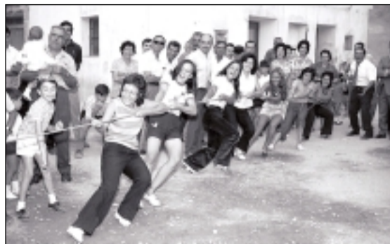
Juego tradicional. LA VIDA EN UN MINUTO