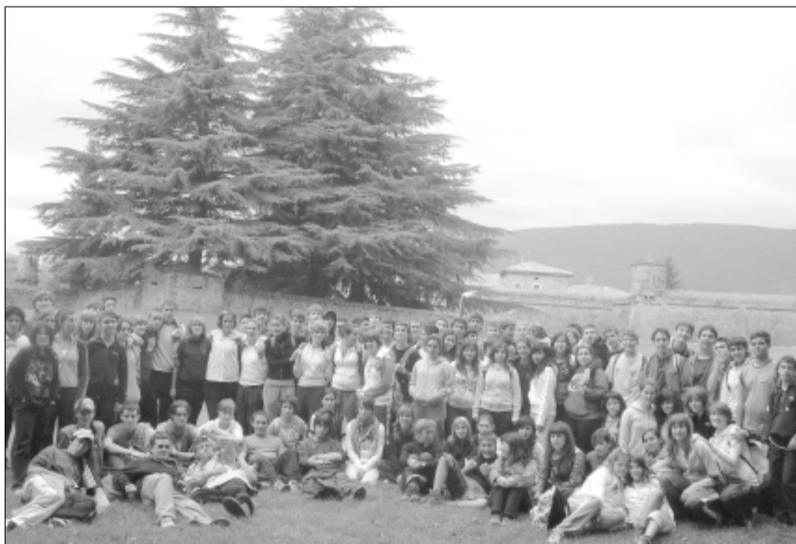
Posando junto a la Ciudadela de Jaca. S.E.

El recorrido, compartido con los peregrinos, junto al río Aragón, les llevó por el Puente de los Peregrinos de Canfranc, la cueva 'As guixas', Castiello, hasta Jaca.