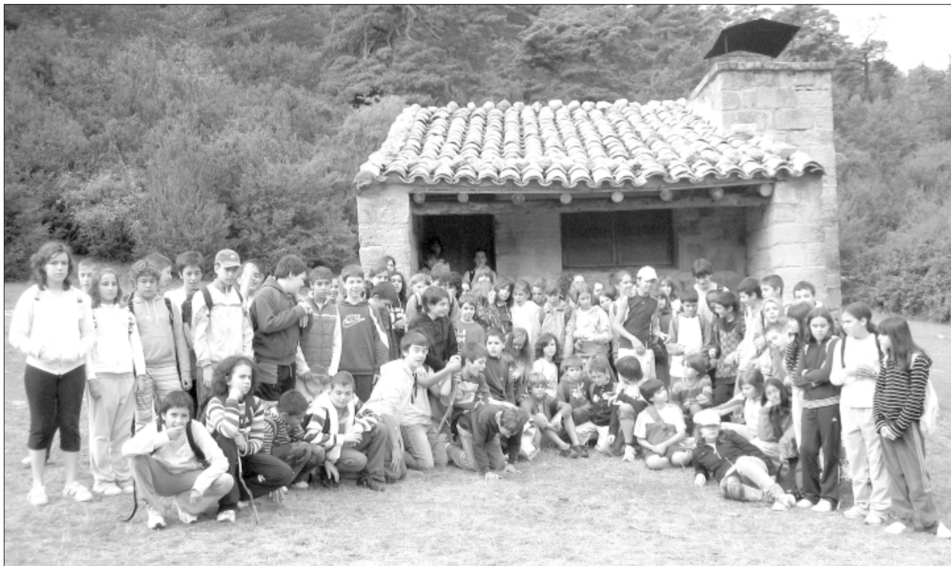
Los alumnos de 1º de ESO disfrutaron en el paraje de Fuenfría jugando en el prado y su entorno. S.E.