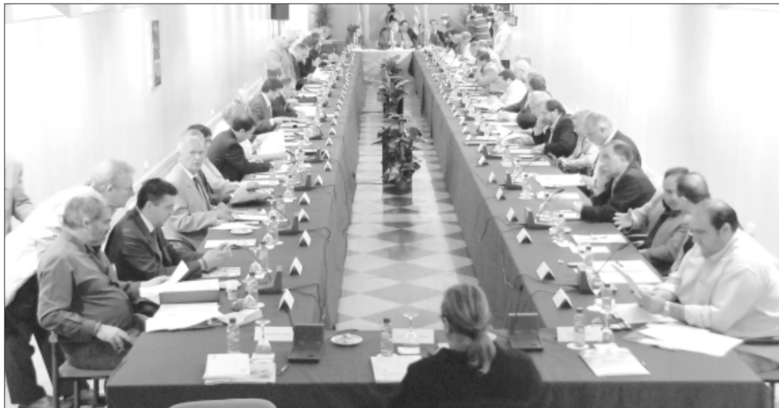
Imagen de la reunión de la Comisión del Agua. S.E.