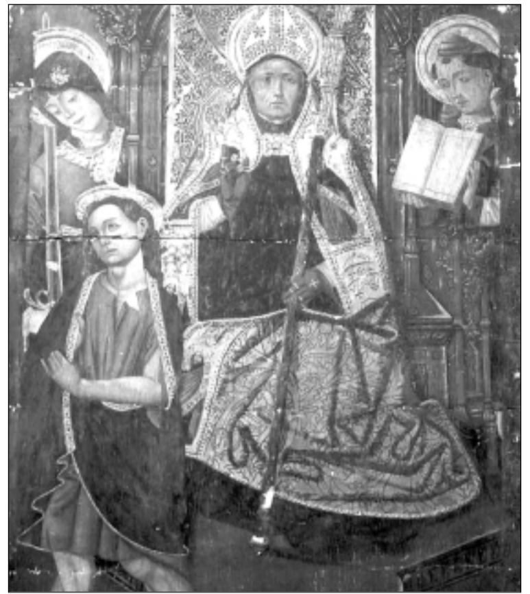
Tabla de San Martín del siglo XV procedente de Lascuarre.