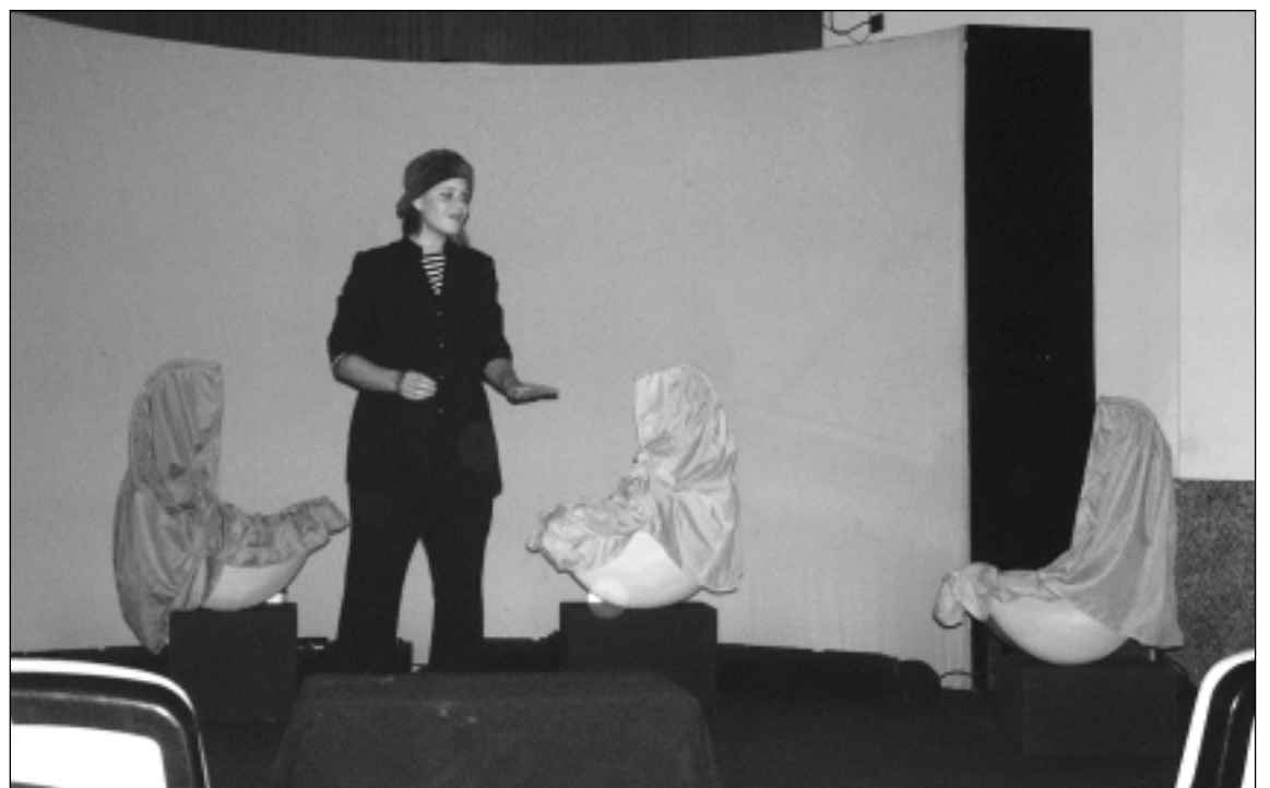
La protagonista de la obra con los 'bebés' que duermen en sus cunas. N.L.A.

Como broche final, las estrellas también dejaron un regalo para todos los niños, un regalo elaborado con agua y el trigo que da la tierra, con aire y con fuego... Todos aquellos que cerraron los