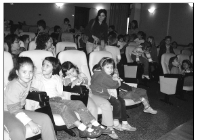
Un centenar de personas, especialmente niños, disfrutaron con la obra. N.L.B.

'Estrellas' fue la primera actuación del Ciclo de Títeres y Teatro Popular que tendrá lugar en Barbastro el primer jueves de cada mes. El próximo 2 de noviembre, la compañía Cucaramá-cara de Costa Rica representará 'Perico de los palotes'. El 30 de noviembre, tomará el relevo la compañía Pa Sucat de Cataluña con 'Las Maravillas de Oriente'. En ambos casos, las representaciones tendrán lugar a las 18.30 horas en el salón de actos de la UNED de Barbastro.