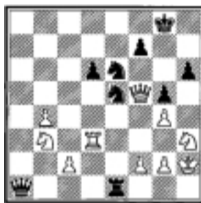
Juegan negras y ganan.

7: BULEVAR, LEÑADOR, PEÑAROL, UTOPICO. 6: CORDON, OCELOS, PARAJE. 5: ARETE, ATOAR, AUREO, EPICA, ILOTA, JASPE. 4: LOAR, NAME, OBUS, PALE, SOPA. 3: APO, CAM, IVA, OCA. 2: CO, EL, OO, UT.