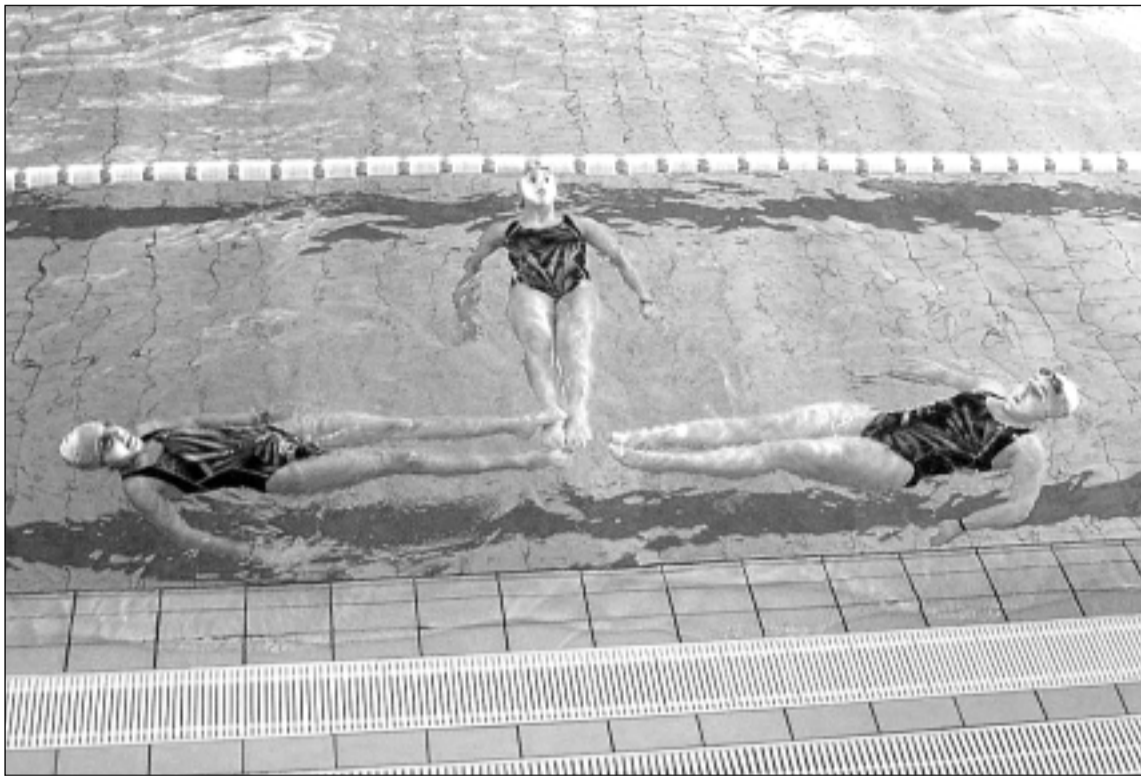
El equipo altoaragonés se da cita en el Campeonato de España este fin de semana. N.L.A.