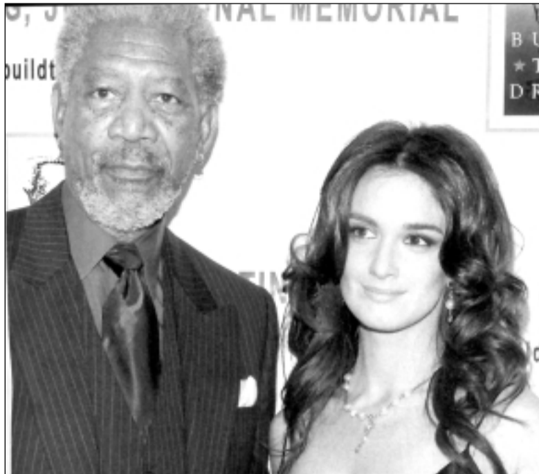
Paz Vega acudió a los Oscar invitada por Morgan Freeman

La fiesta de los Oscar protagoniza el reportaje fotográfico más espectacular de la semana, en una edición sobria con "Crash" como protagonista