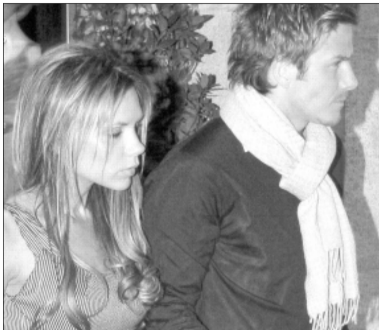
David y Victoria Beckham son las estrellas donde quiera que vayan