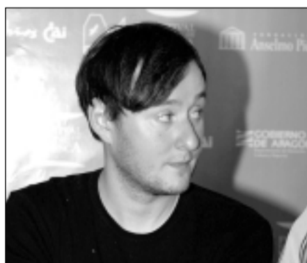
Runar Runarsson, en el festival de Huesca. D.A.

El cortometraje ganador del último Premio Danzante, Sidasti Baerinn (The last farm), del cineasta islandés Runar Runarsson, recibió el reconocimiento de la Academia de Hollywood, al ser seleccionado entre los cinco trabajos finalistas al Oscar en el apartado de Mejor Cortometraje. Sidasti Baerinn, que finalmente no logró la estatuilla dorada, sí cosechó en Huesca el aplauso y el máximo galardón del Certamen Internacional durante la 33 edición del Festival. Por otro lado, el corto Medianeras, con el que el argentino Gustavo Taretto cosechó el Premio Cacho Palleró, también en la pasada edición del Festival