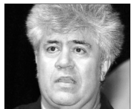
Pedro Almodóvar.

Tras 25 años en el cine, Pedro Almodóvar reconoce haber perdido “muchas cosas en el camino”. Se ha alejado de la realidad para emprender un viaje hacia la soledad, lo que ha hecho que sus filmes se hayan “interiorizado”. “Ahora debo recurrir a mí mismo para contar historias. Y eso es algo desgarrador”. “Leo las cosas que escribía a mediados de los ochenta y eran delirantes. Usaba la realidad para distorsionarla y burlarme de ella y esa era una característica personal mía que pensé que nunca perdería, como la piel o el color de ojos; pero ahora veo que lo he perdido y lo siento como una enorme ausencia”, cuenta el realizador,