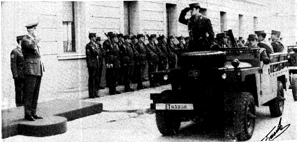
Calahorra. Se trasladó directamente al acuartelamiento «Sancho Ramírez», sito en el barrio del Perpetuo Socorro. Fue recibido por el gobernador militar y segundo jefe de