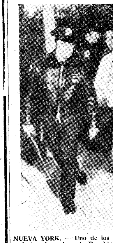
NUEVA YORK. — Uno de los cuatro atacadores del establecimiento de artículos deportivos de Brooklyn, que se entregaron a la Policía después de que los rehenes consiguieron escapar.