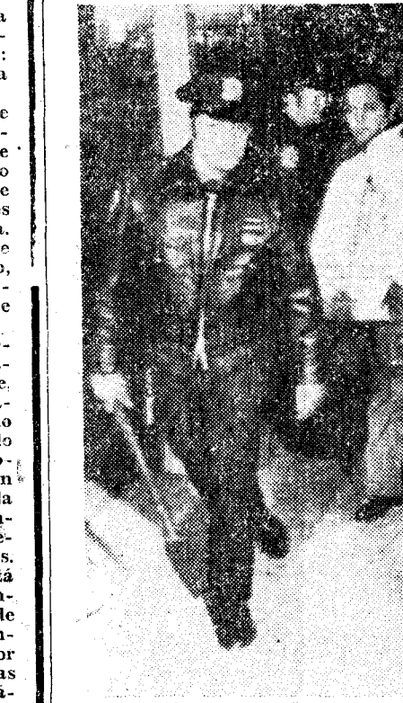
NUEVA YORK. — Uno de los cuatro atacadores del establecimiento de artículos deportivos de Brooklyn, que se entregaron a la Policía después de que los rehenes consiguieron escapar.