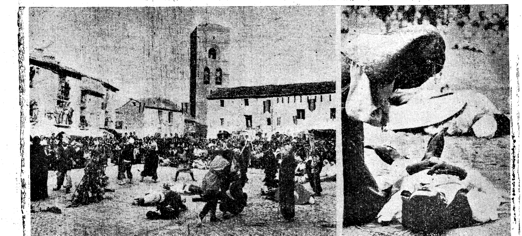
Como colofón de las fiestas de Aínsa, la bella localidad oscense, se celebró la tradicional lucha entre moros y cristianos, que, naturalmente, perdieron los moros. A la derecha, una mora llora desconsolada la muerte de su amado.

MADRID, 22. — El "Boletín Oficial del Estado" publicará mañana, entre otras, las siguientes disposiciones: Ministerio de Educación y Ciencia.— Decreto sobre Colegios Universitarios. Decreto sobre implantación del primer ciclo en los estudios de enseñanza superior. Resolución por la que se publica convocatoria para formular propuestas de concesión de la Orden de Alfonso X el Sabio en su sección especial "al mérito docente". Resolución por la que se anuncia la provisión de una vacante de académico de número de la Real Academia Española. — Pyresa.