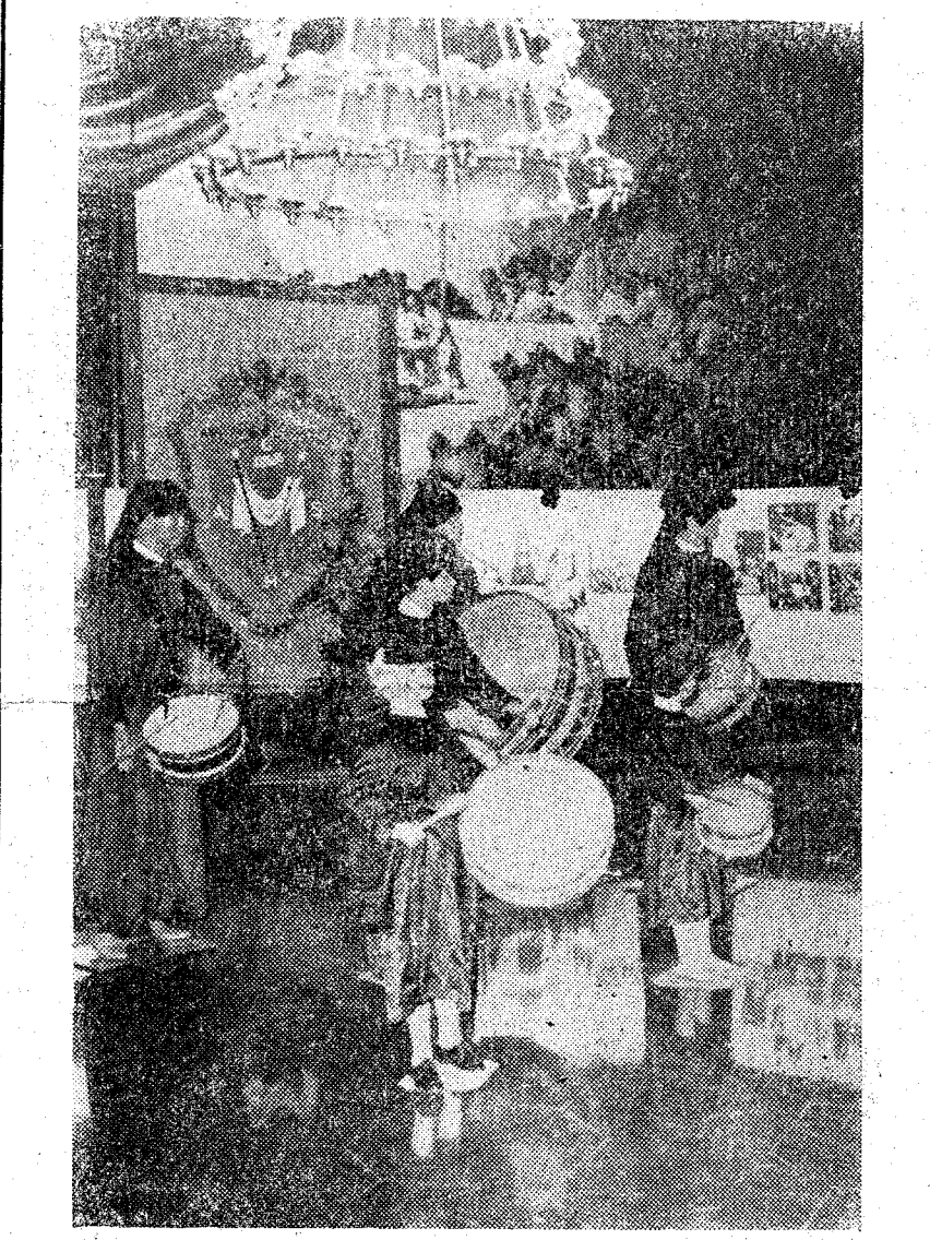
BARCELONA. — Aspecto del Salón de Crónicas del Ayuntamiento barcelonés, donde fue inaugurada la exposición de fotografías y otros objetos de la Semana Santa de Híjar (Teruel).