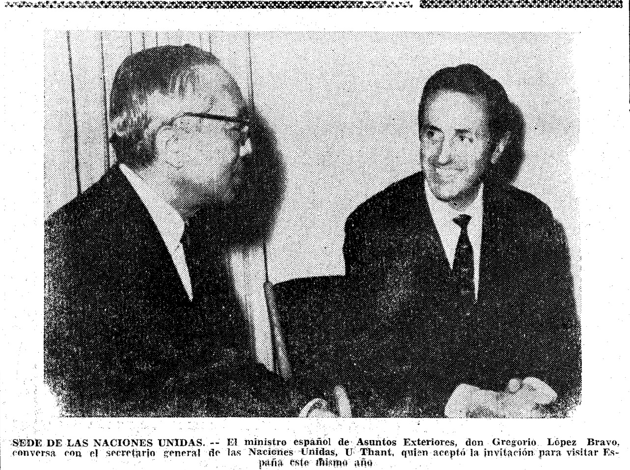
SEDE DE LAS NACIONES UNIDAS. — El ministro español de Asuntos Exteriores, don Gregorio López Bravo, conversa con el secretario general de las Naciones Unidas, U Thant, quien aceptó la invitación para visitar España este mismo año.

Por último, el alcalde de Barcelona ofreció en el Palacete Albéniz una cena al ministro y a los directores generales que le acompañaban. Asistieron a ella, entre otros señores, (Continúa en la sexta página)