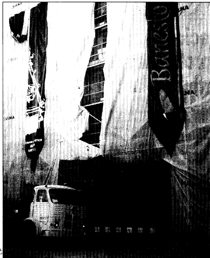
Estado en que se encuentra la Casa Pradas, de Jaca.

El retraso en la formación de esta entidad técnica de participación ciudadana ha venido dado, en parte, por las circunstancias ligadas a la aprobación del PERI del casco histórico, ya que en principio la Comisión de Urbanismo del Ayuntamiento consideró a principios del 96 que después de 20 meses sin obtener respuesta de la Comisión Provincial se consideraba esta aprobación por el