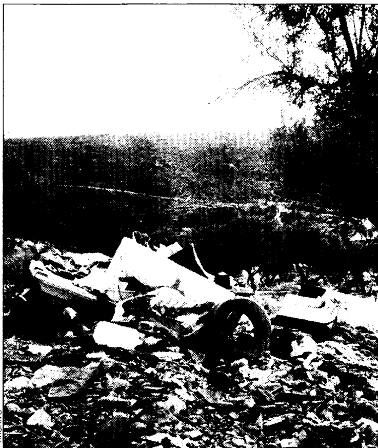
La gestión de los residuos, una de las asignaturas pendientes.

Recordó que ya se ha llegado a un acuerdo con ocho Ayuntamientos, que serán las "cabece- ras" del plan, al que se presenta-