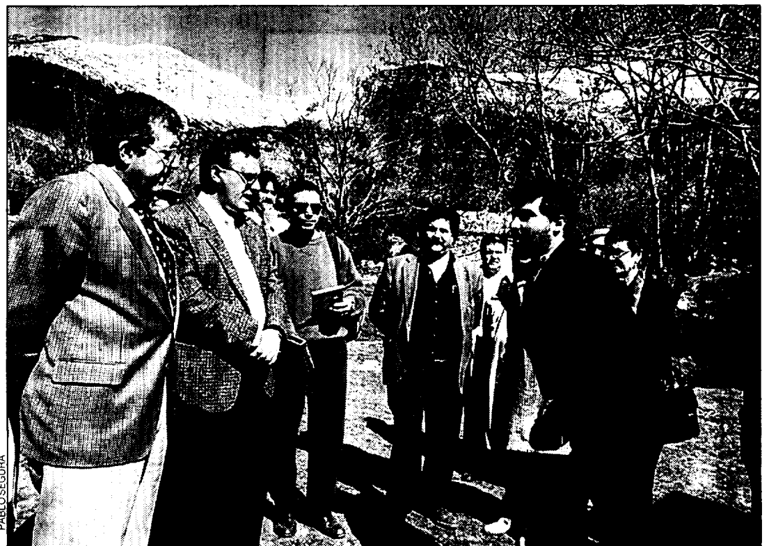
Un técnico explica a las autoridades las características de la nueva instalación.

La nueva instalación, sin embargo, no ha sido del agrado de todos los vecinos que tienen intereses en Escuaín. Algunos de ellos se quejaron ayer de que el sistema elegido por los técnicos no tiene toda la potencia que se precisa para hacer frente a sus necesidades.