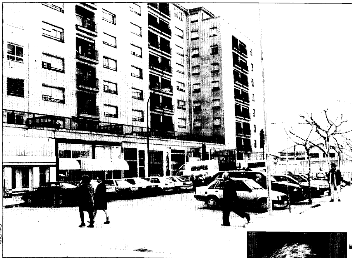
Imagen del barrio de San José.

El barrio de San José celebra durante esta semana sus fiestas. Con a penas 15 años de vida, se trata de un distrito joven. Sus problemas fundamentales son anteriores incluso a su 'nacimiento'. Uno es la vía del tren, el otro, el problema para el tráfico que supone el área cerrada del antiguo matadero. La Asociación de Vecinos espera, además, que se le proporcione un nuevo local social.