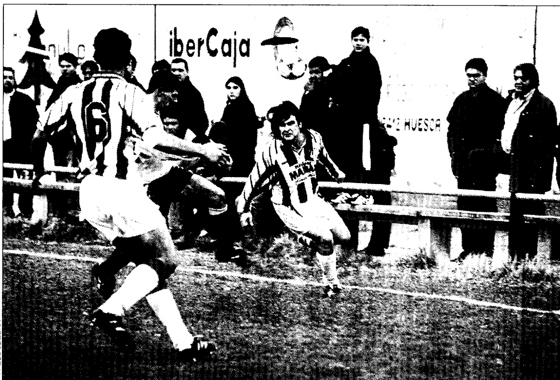
El Barbastro recibe a un incómodo Alcañiz en el Municipal.

Barbastro-Alcañiz, Villanueva-Fraga y Monzalbarba-Sariñena completan la jornada en Tercera