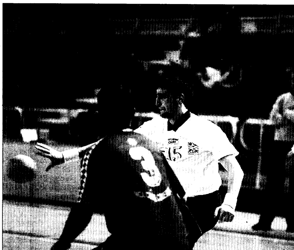
Arrarás fue una pesadilla para los baleares en el segundo periodo

BM.Huesca, tras un primer tiempo de "pesadilla", rompió al Mega Inca en la segunda mitad (30-23)